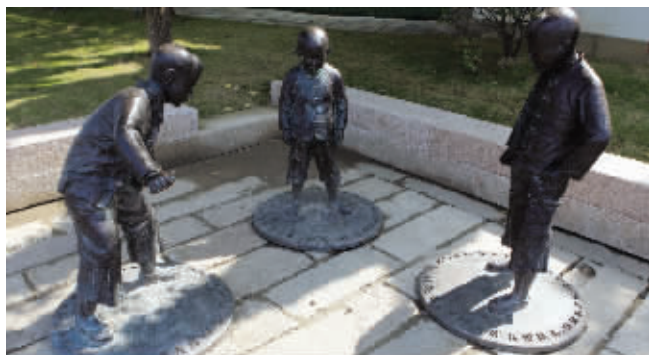
地上的陀螺不翼而飞,只剩下3个孩子