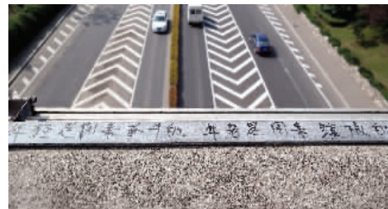
亮化铁架上的涂鸦:年轻是用来奋斗的,年老是用来绽放的