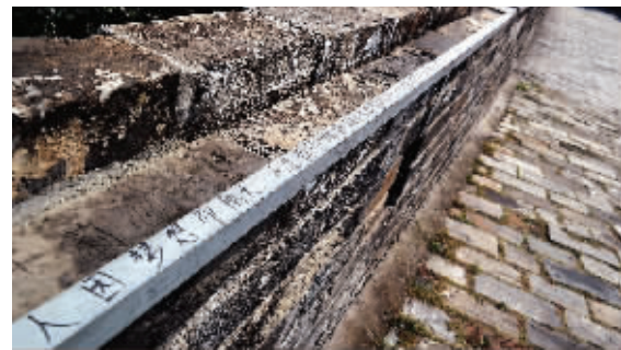
亮化铁架上的涂鸦:人因梦想而伟大……