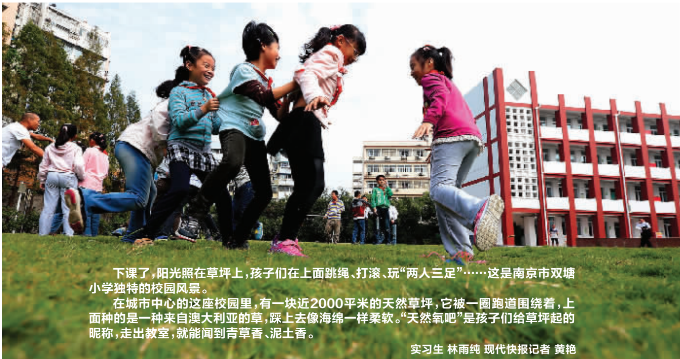
下课了, 阳光照在草坪上, 孩子们在上面跳绳、打滚、玩“两人三足”……这是南京市双塘小学独特的校园风景。

草坪还是孩子们上科学课的好地方, 这里的昆虫、小鸟、露珠、土壤, 能让孩子们切身感受到大自然的细微变化。