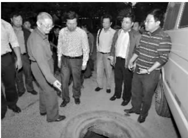
周金良蹲点雨污分流现场了解情况

国庆七天假,南京市住建委主任周金良整天泡在小区出新和雨污分流工地上。昨天傍晚,现代快报记者在建委会议室找到他时,他还在开会,和各处室负责人讨论这几天“蹲点”中发现的问题,该怎么解决。“其实很多工地以前我也去过,但当时没发现这些毛病。这说明我们的工作,确实有问题,不够细致。”周金良说,这几天的“蹲点”,让他更了解老百姓的诉求,在与居民的沟通中,也让大家更理解了小区出新与雨污分流工程。