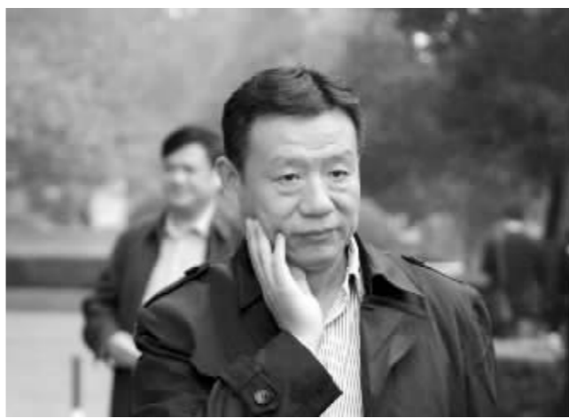
如何把渣土车的速度降下来,是许卫宁正在思考的问题

国庆长假,南京市城管局局长许卫宁就没闲着。他领到的“家庭作业”是暗访渣土车,和渣土车老板“唠嗑”。