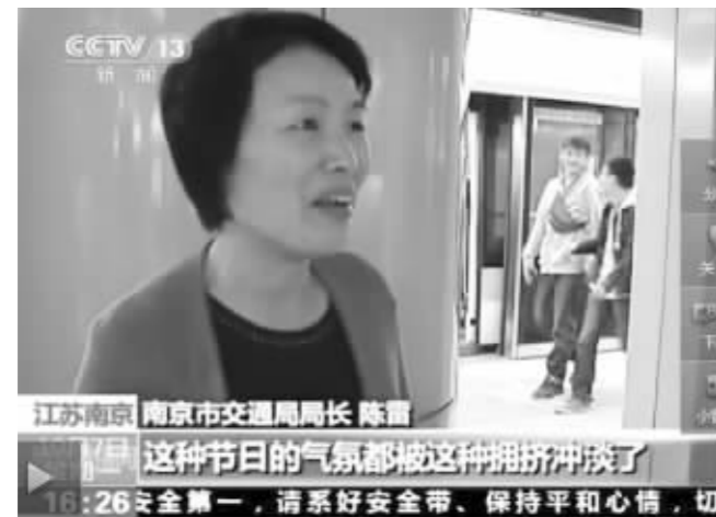
陈雷挤地铁的新闻昨天上了央视 视频截图

长假7天,南京市交通局“女当家”陈雷局长没时间陪家人游玩,每天穿梭在城市中,换乘各种交通工具。昨天现代快报记者联系上陈雷时,她正奔波在“宁高新通道”的建设现场。今天上午,交通局将就“作业”中碰到的问题进行汇总、整理,然后进一步研究,拿出整改方案。