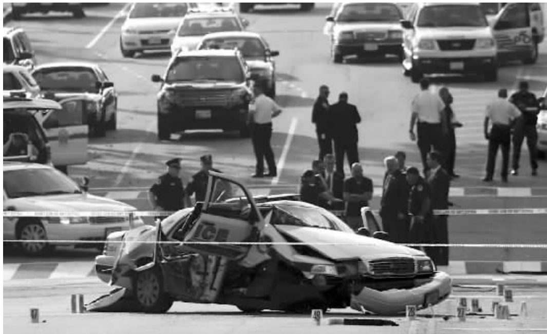
安全人员封锁美国华盛顿国会附近街区