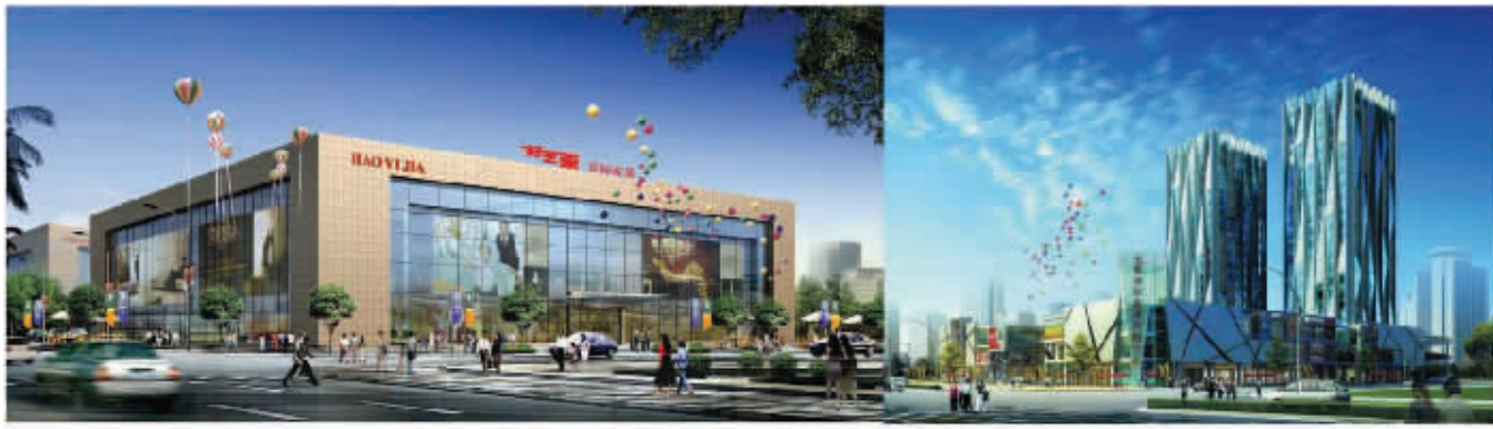
好艺家国际家居广场