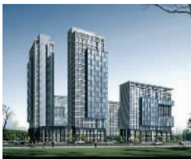
东鹏国际家居创意产业中心