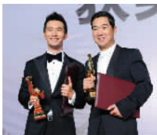
黄晓明和张国立一同获封影帝

本届电影节“影帝”“影后”的奖项都出乎意料。其中,影后之争十分激烈,章子怡、张静初、梁静都是很有实力,而新崛起的杨子珊也不可小觑。但是最终,小宋佳却凭借口碑平平的《萧红》爆冷封后,让人大跌眼镜。