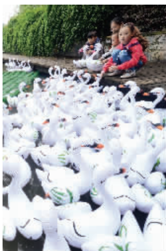
充气大白鹅免费送