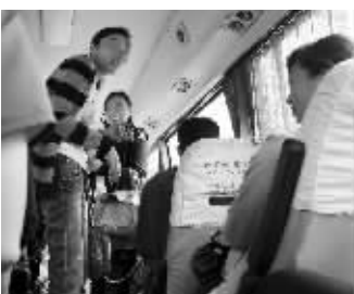
工作人员带游客转车三次见到导游