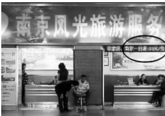
大屏幕上“50元/位”吸引了不少游客