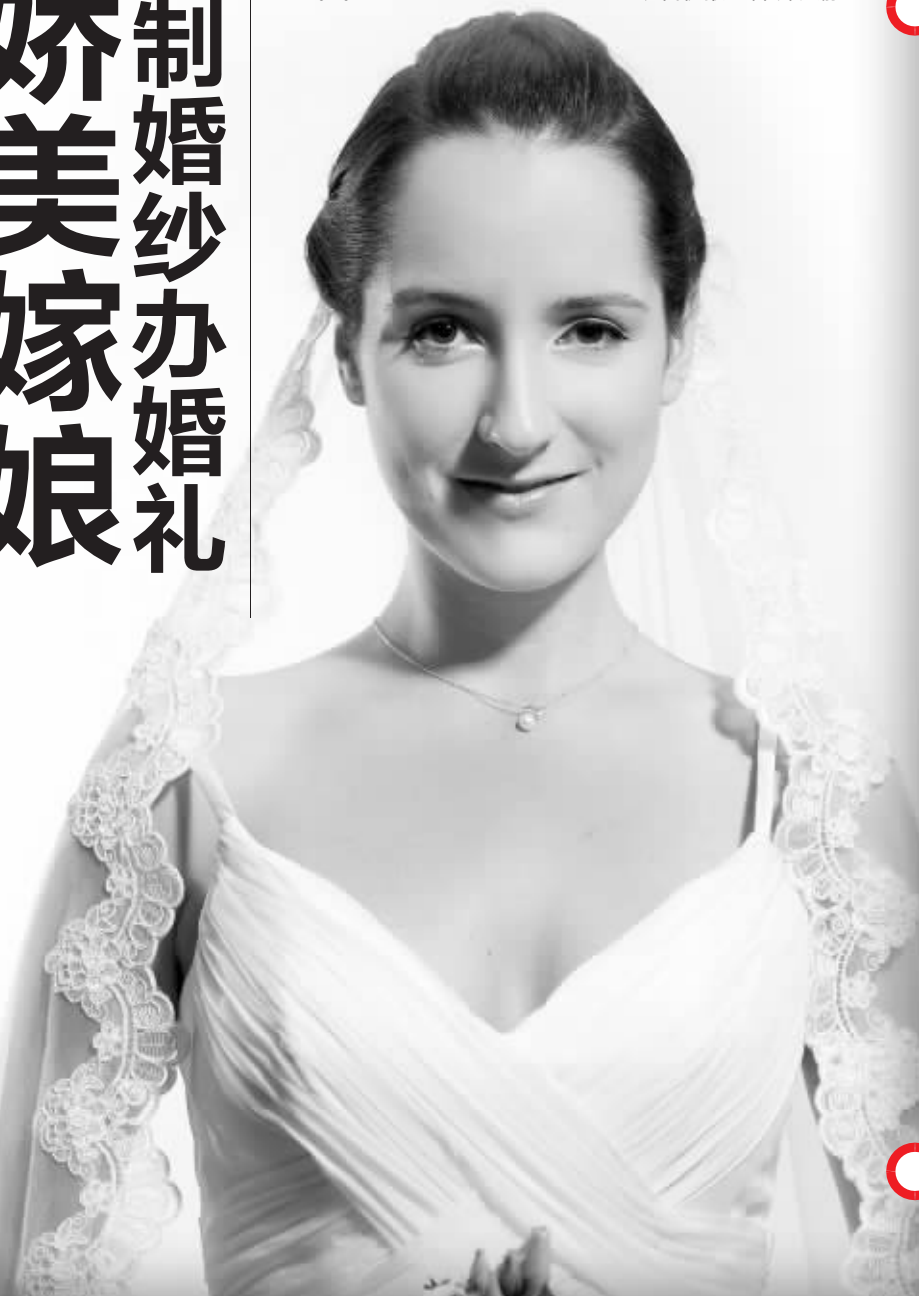
网友“@WENWEN_GUO”设计的一款婚纱