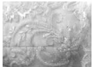
婚纱上还可以加些小装饰

四块纸板裁剪好之后,再按照纸板大小,剪出相应的四块布料。布料要比纸板稍微大点,留出缝纫需要的边,然后把四块布料缝在一起。拼接方法可以参考自己平日里穿的T恤和连衣裙。