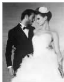
桃心款婚纱 资料图片