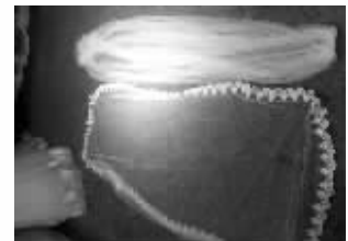
两款不同风格的头纱

如果你没有完成,也不要灰心,做婚纱确实是有难度的。而且,婚纱虽然重要,但幸福的关键毕竟不是在于婚礼,而是在于日常生活中的相濡以沫。