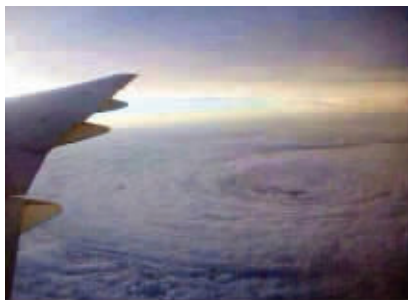
古巨基微博上的图

台风“天兔”的确是只不好惹的兔子,不仅给华南带去严重影响,造成广东省356.3万人受灾,25人死亡,还引发了不小的争论。这不,知名艺人古巨基在微博上发了个图,被很多人以为是“天兔”而被大量转发,实际