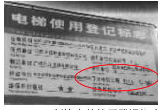
新换上的使用登记标志