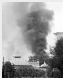
购物中心升起浓烟