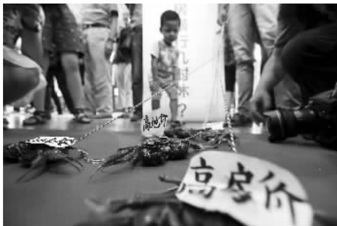
房展会现场,市民遛螃蟹

“南京房价太高了,我只是想通过这个行为艺术,表达我对南京房价的看法。”“遛蟹哥”说。