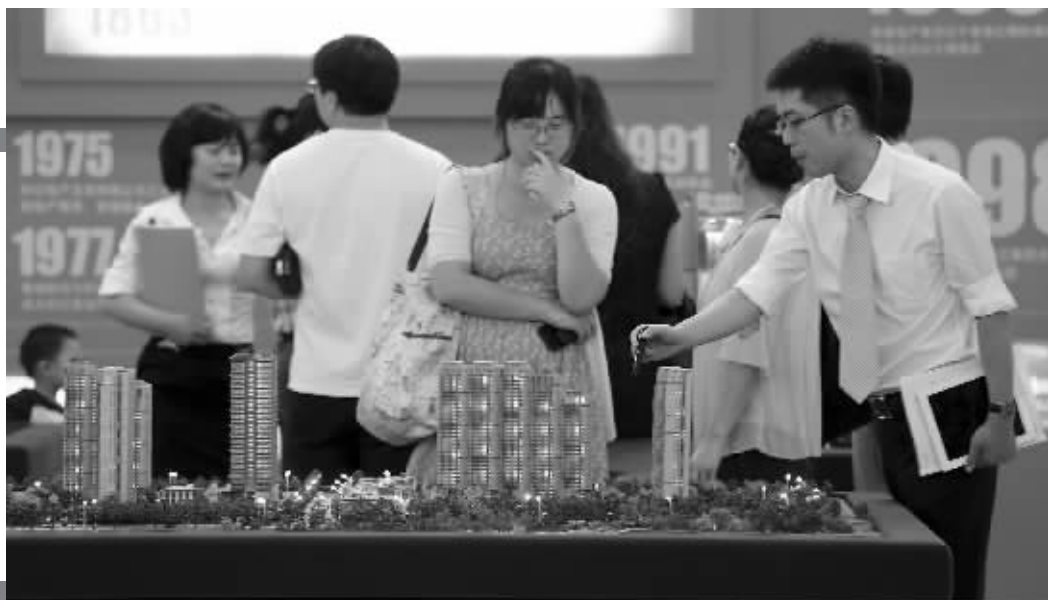
不少市民希望在房展会上淘到房