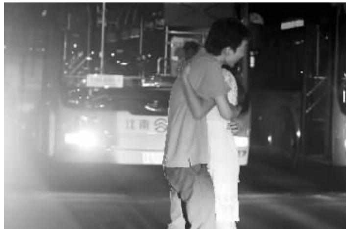
求婚成功