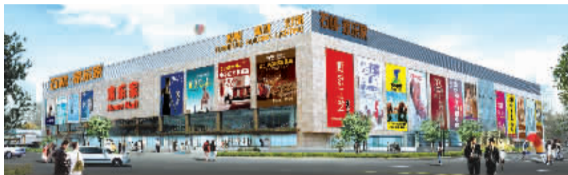
石林家乐家效果图