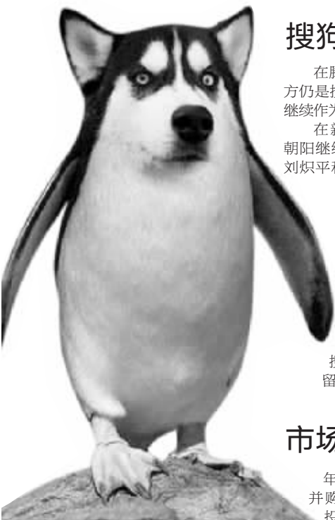
网友恶搞腾讯入股搜狗后的企业形象