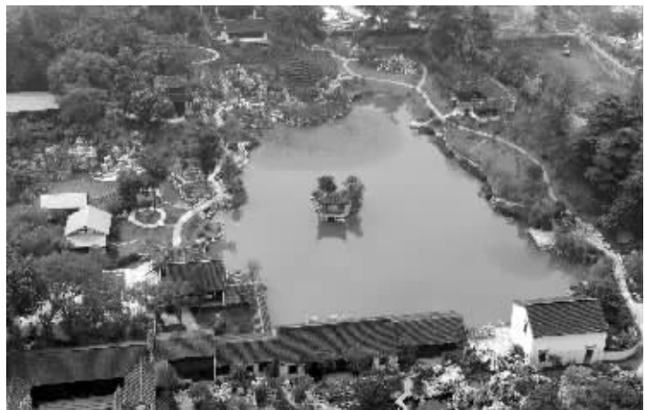
胡家花园全景图

听了王奶奶的讲述,问题似乎露出了一点头绪,但却更加扑朔迷离。胡家为何会从王家过继孩子? 而断了联系的胡大农又去哪儿了? 网络时代资讯的畅通,让记者在网上一似乎找到了一位“知情者”。“知情者”在博客中透露了不少关于胡家花园的情况,和王奶奶所说信息多有吻合。多方打听后,记者终于和“知情者”联系上,惊喜地发现,原来他正是胡大农的小儿子——胡宜生。胡家花园的秘密一点点揭开。