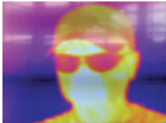
现代快报记者体验结果显示 鼻孔热能最多