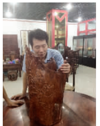
价值16万的黄花梨笔筒 现代快报记者 赵丹丹 摄

为什么笔筒的价格如此之高?工作人员介绍,主要是它制造的材料是越南黄花梨,“黄花梨为落叶乔木,木性极为稳定,不管寒暑都不变形、不开裂、不弯曲,有一定的韧性,适合制作各种异型家具。”工作人员称,明清时期考究的木器家具都选“黄花梨”制造,在我国主要是海南盛产黄花梨,越南也比较多。因为黄花梨生长周期长,一般直径多长1厘米,就需要7—8年的时间,所以笔筒用料的黄花梨直径40厘米,起码