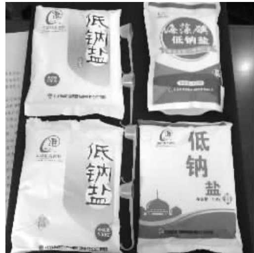
发布会上,盐务局展示的低钠盐