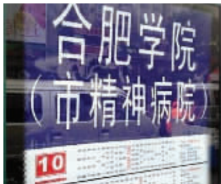
合肥学院站公交站牌