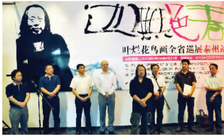
开幕式现场叶烂致词