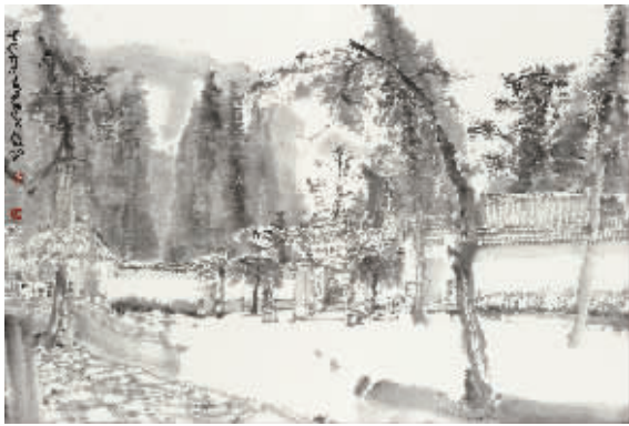
周京新《兴福寺写生之八》58cm×86cm 纸本水墨