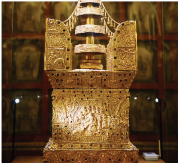
“整形美容”之后,阿育王塔金光闪闪