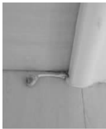
业主家地板墙角长出了蘑菇