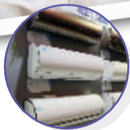
美的“一晚一度电” 空调受追捧