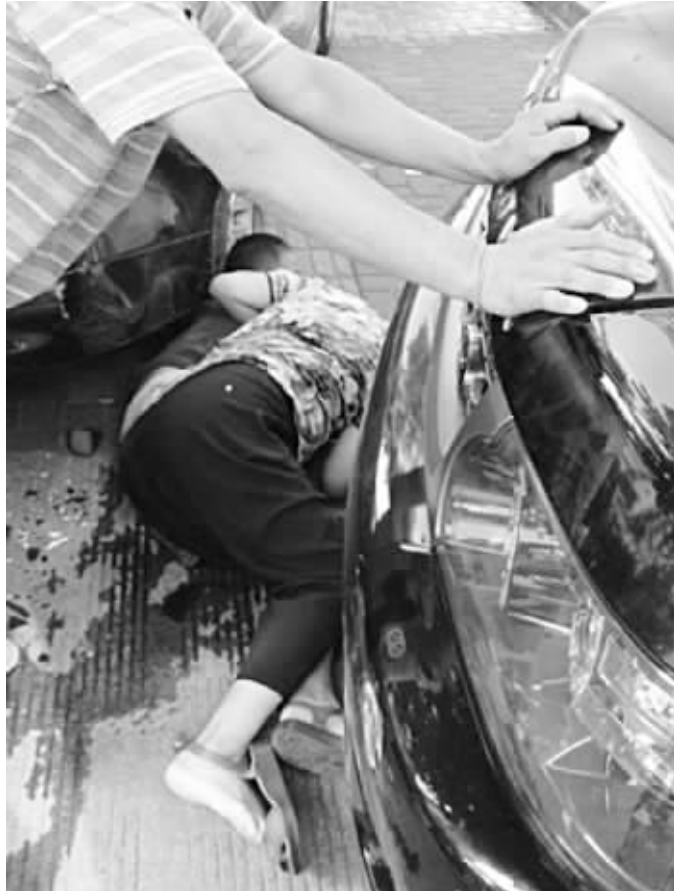
阿婆和孩子被救的场景

经交警初步判断,可能是肇事司机到平地上后想踩刹车,混乱中踩到油门,于是车子失控发生悲剧。目前事故具体原因还在进一步调查中。