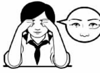
按太阳穴、轮刮眼眶