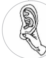
揉捏耳垂,脚趾抓地

在目前试点的六节眼保健操中,按揉风池穴和揉捏耳垂脚趾抓地是两个新增的动作,那么,这些动作对于保护视力,能起到什么作用?