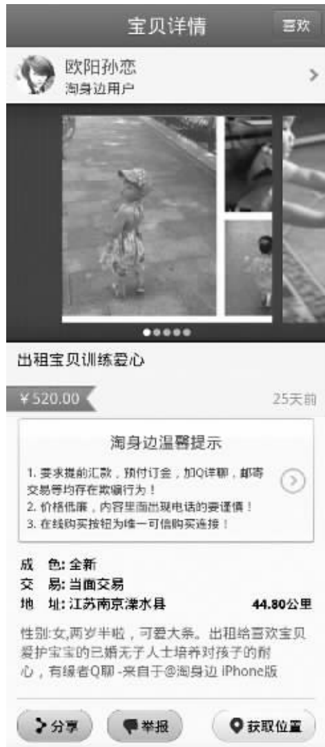
网友网上出租小孩的租售信息 网络截图

如今,房屋、汽车、闲置物品的各类租赁信息你一定不会陌生,可你听说过出租活生生的孩子吗?这样的事还真有。近日,南京一名网友在其微博上发布了一则信息,要出租自己两岁半的宝宝,价格为520元每天,她声称这么做的目的是想将孩子租给已婚无子人士,培养他们对孩子的耐心。对于这种“新鲜事”,引起网友热议,但是律师提醒,千万不要去尝试,因为出租孩子的行为是违法的。实习生 蔡春雨 现代快报记者 马薇薇