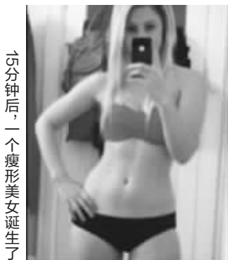
15分钟后,一个瘦形美女诞生了