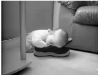
这枕头不错,就有点臭