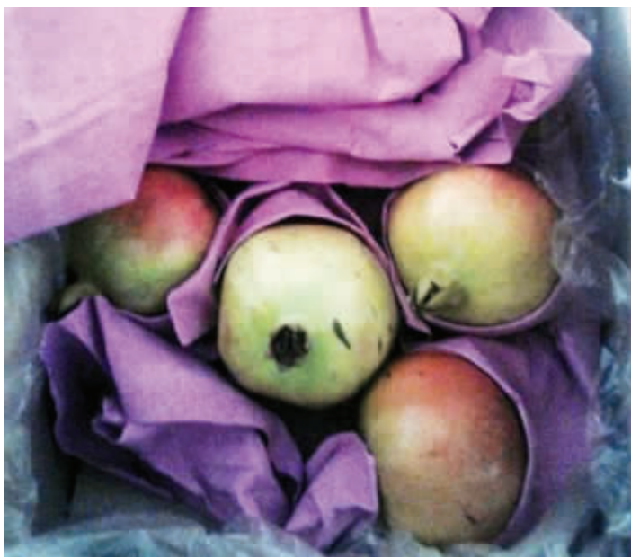
水果店里的石榴,都用卫生纸包着