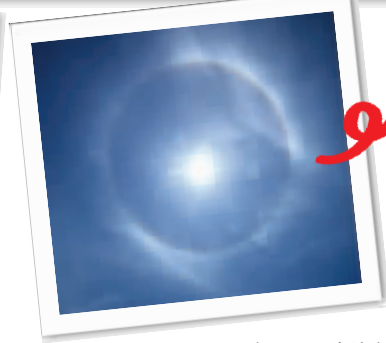
彩虹、日晕为资料图片

快报讯(记者 刘伟伟)最近的蓝天白云格外美,让人不自觉地抬头看看天空。昨天下午,不少南京市民抬头时,意外发现了一个美丽的“彩虹”,倒挂在天上。