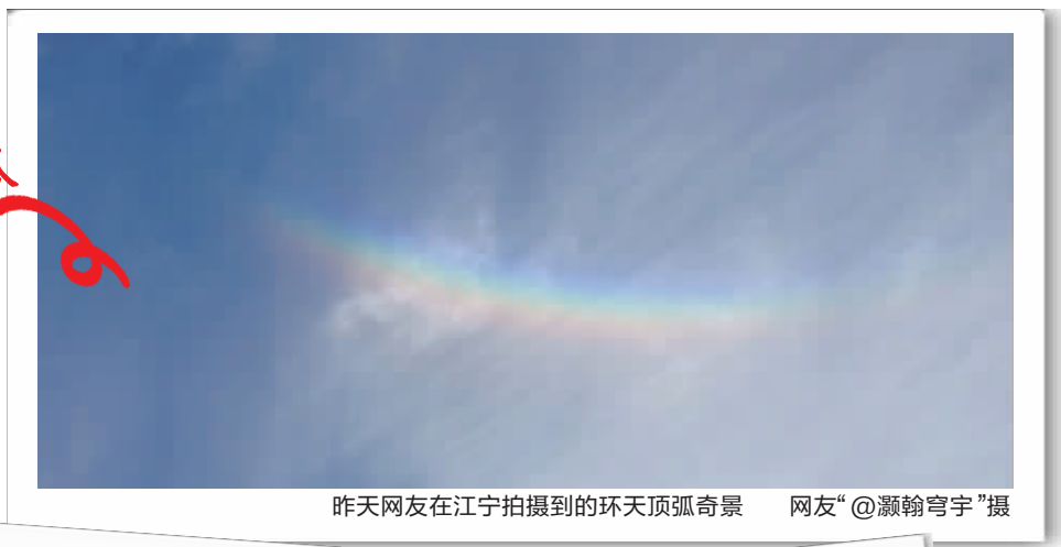
昨天网友在江宁拍摄到的环天顶弧奇景