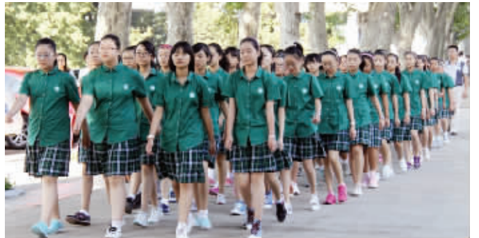
女生们去参加升旗仪式