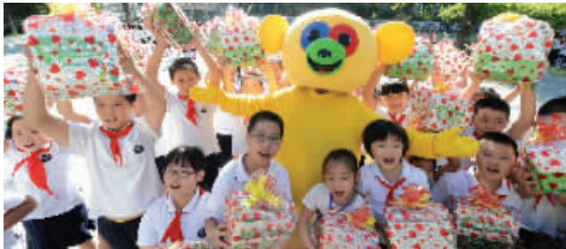
南师大附小的开学典礼上,学校向学生赠送“爱之袋”

实习生 林雨纯 通讯员 冯永升 严莉 卫元勋 现代快报记者 黄艳/文