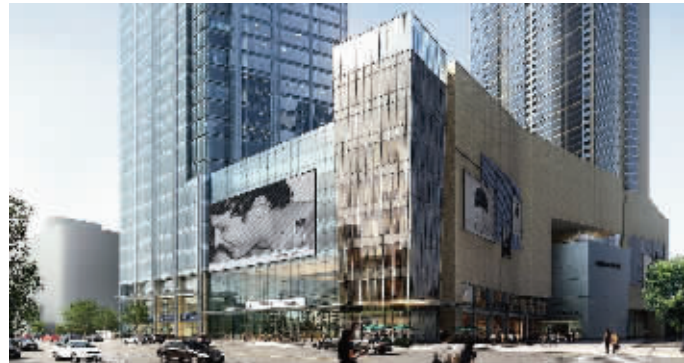
无锡苏宁广场效果图 资料图片