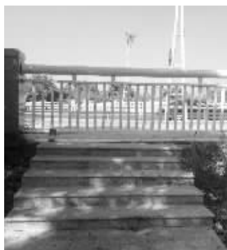
桥附近的下桥台阶至今未打通栏杆

“蠡湖大桥南桥晚上的下桥台阶造好了为何迟迟不使用?”昨日,有网友爆料称,原来市民若经过蠡湖大桥前往无锡大剧院的话,必须绕道蠡湖大桥的匝道,十分麻烦。为此,相关部门专门在蠡湖大桥上修建了一个下桥台阶,现在台阶已经造好有一段时间了,却迟迟不启用,希望相关部门能早日有个说法。