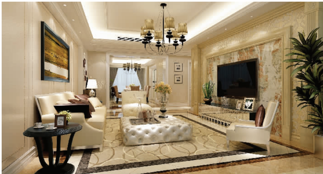
龙瑞装饰 首席设计师 黄永俊创作