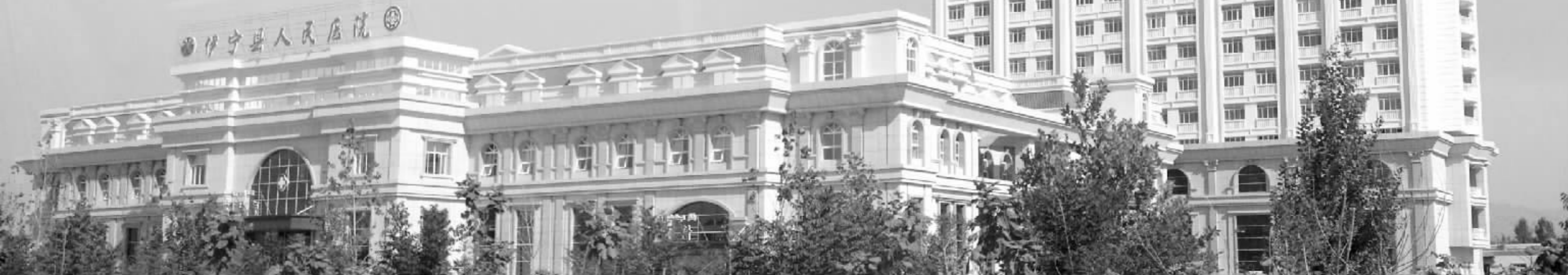
南通援建的伊宁县人民医院一期工程正在接受国家“鲁班奖”评审

2010年以来,江苏南通已支援新疆伊宁3.89亿元 援疆“南通模式”变“输血”为“造血”