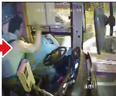
男子猛打司机后脑勺