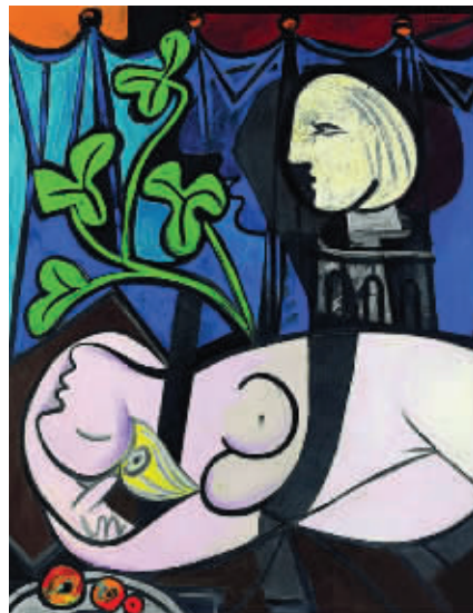
《裸体、绿叶和半身像》

刚才讲的是空间的脉络，回到时间的脉络，我们不得不讲塞尚。西方人喜欢认爹，什么意思呢，就是说我们的血脉，我们的资源，我们今天做这个事情，都是“其来有自”。塞尚从哪里来？表面上他从印象派来；印象派又从哪里来？印象派其实是从巴比松过来的，包括一部分英国过来的。此外刺激印象派的还有一个原因，就是石油已经发现了，整个资产阶级时代和现代文明开始了。18世纪末19世纪初的古典主义已经无法满足，画得像不像美不美已经不是画家关心的了，画家注意到有很多的事情可以做，用颜料、用笔触、用光线，用温度表达不同的世界，而不是像从前一样模拟现实世界。资产阶级时代开始了，这才会有印象派。这个仍然没有说明塞尚从哪里来，塞尚的理想是我要回到图桑的时代。图桑是17世纪的人，跟塞尚相差200多年。图桑一辈子待在意大利，他的理想是什么，他的理想是文艺复兴，而且真正的理想来自希腊。我们想一想这个问题，塞尚是现代主义之父，马蒂斯说我们都从这里来。从塞尚回到图桑，图桑回到希腊，这样的时间纬度对以后中国引进展览就是一个漫长的名单，可以把西方的整个文脉带进来。这不一定是奢望，这个名单应该在我们期望邀请的当中。