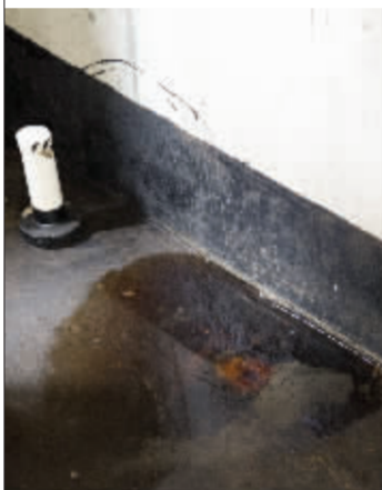
类似渗漏在买二手房时是不容易发现的