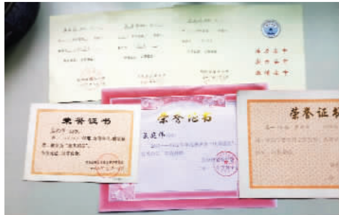
孟庭伟的奖状

“他学习很刻苦,还是班里的学习委员。”说起孟庭伟,他的班主任吴宗南赞不绝口。今年高考孟庭伟考出了328分的好成绩,在班级排名靠前,被南京金陵科技学院软件工程专业录取。