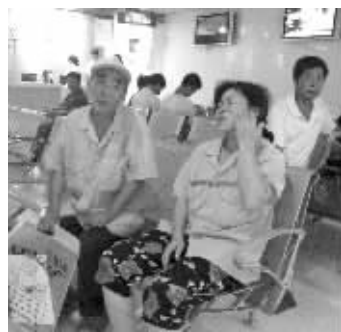
曹师傅与老公在医院