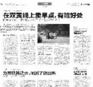
早在2011年9月24日,现代快报就曾报道南京军区总院门口小贩与城管“打游击”