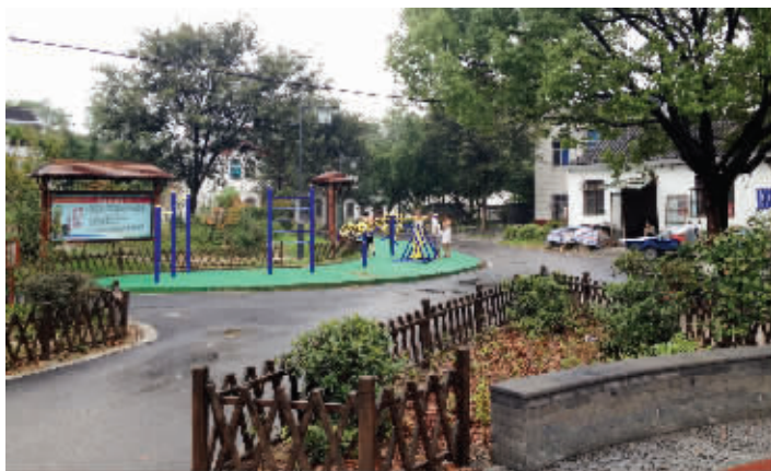
整治一新的前寺舍自然村

现由73家全是周姓人家组成的桃源村前寺舍自然村,据传村民是宋代理学大师周敦颐后代,清雍正年间周氏后裔到此落脚,子孙耕读传家,恪守祖宗遗训,除种植稻麦瓜果,兼种与莲花有相通之处的水芹为副业,以寓清白做人之心,历史上“寺舍芹菜”誉满常州府地区。