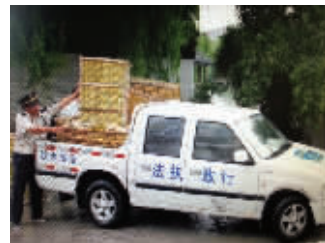
鸽笼运了整四车

每年都会吸引不少游客前来,这些鸽笼堆放在书院旁,实在有损无锡形象。现场城管队员花了一个多小时,用皮卡执法车分四趟才运走了这些鸽笼。