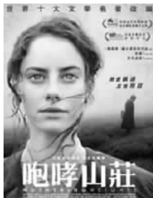
《呼啸山庄》在香港被译成《咆哮山庄》

香港翻译影片时喜欢剧透,这点遭到网友的强烈吐槽。例如,影片《老无所依》在香港被翻译成《200万夺命奇案》,《无耻混蛋》在香港被翻译成《希魔撞正杀人狂》。还有一些香港翻译的电影名,看片名就让人吐槽无力。比如,电影《史密斯夫妇》在香港被翻译成《史密斯夫妇》;《魔戒3:王者归来》在香港被翻译成《皇上回宫》;《进化危机》在香港被翻译成《地球再发育》;《国王的演讲》在香港被翻译成《皇上无话儿》;《黑客帝国》在香港被翻译成《二十二世纪杀人网络》;《这个男人来自地球》在香港被翻译成《地球不死人》……网友表示,自己就是因