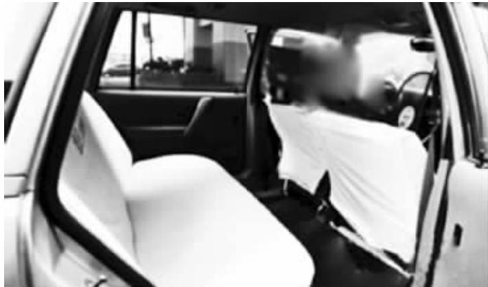
出租车后排非常整洁美观,可是,安全带被“雪藏”了

Q 坐车要系安全带,这是每个人都应该知道的常识,然而有市民发现,在乘坐出租车时,车子后排座椅上套了一层椅套,致使后排安全带卡扣要么被拆除,要么被隐藏,形同虚设。“坐在后排的乘客没办法系安全带,实在不安全,有办法解决吗?” 现代快报记者 吴怡