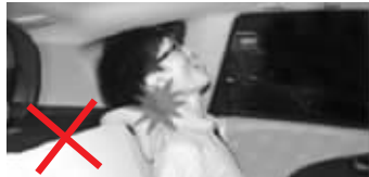
头枕过低,撞击时可能造成颈椎折断