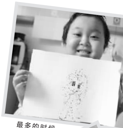
最多的时候 一天能画30多幅

“我们能代她办画展、代她去海边,却不能代她长大、上学、结婚……”一位志愿者说,“现在我们能做的,只有祝福。”