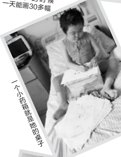
一个小药箱是她的桌子