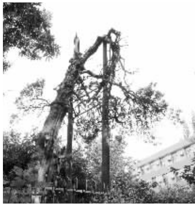
东南大学内的六朝松

正月初二,采石守将徐子建赶回都城汇报军情。陈后主极为震惊,赶忙召集王公大臣商议军机大事,随后任命骠骑将军萧摩诃、护军将军樊毅、中领军鲁广达担任都督,以司马消难、施文庆担任监军,并派遣南豫州刺史樊猛统帅水军屯兵白下城(今南京幕府山南麓,古时要塞),散骑常侍秦文泰镇守南豫州。