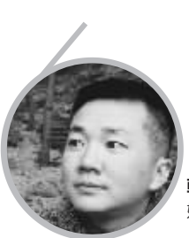
韩松落 娱评人,影评人

有些事,要在很多年后才能明白它的意义。1980年代,新疆南部的小院里,汉人聚会时的谈话,大部分内容都给了刘晓庆,她的《小花》《瞧这一家子》、她的言论、离婚风波,她在报纸上连载的《我的路》,她那些被禁映的电影,她的走穴,她的大耳环和花衣服。即便人类学家罗宾·邓巴指出,人们之间的谈话内容,多半是八卦话题,这种情形恐怕也比较罕见——某段时期的中国人,大部分话题都是刘晓庆。所以,其实我们都知道刘晓庆的年龄,完全不必用Discovery节目做专题,或者资深八卦人士在微博爆料。