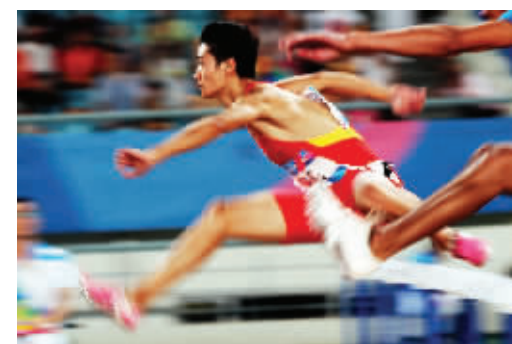
田径比赛男子110米栏预赛