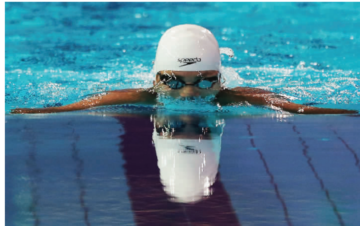
游泳比赛中选手奋力争先