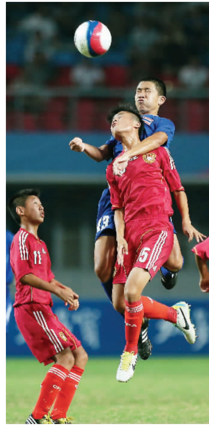
亚青男足中国2:4泰国,小组赛未能晋级