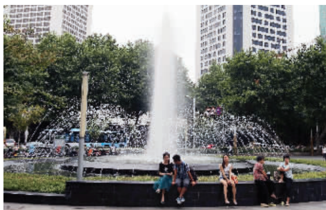
商场景观喷泉

“我们是不会让小孩进喷泉玩耍的。”商场的一名保安就站在不远处, 一直关注着喷泉周围的情况, “我就是专门管这块的, 小孩进去玩, 我会制止。”