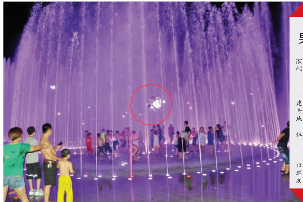
男童被喷起的瞬间 资料图片