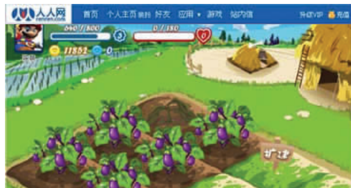
人人网开心农场游戏页面截图