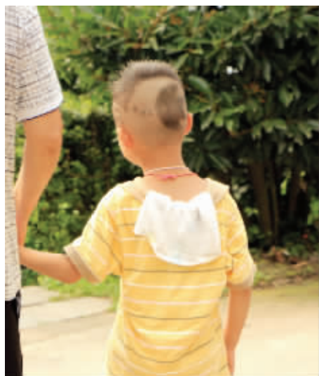
现在流行鱼缸头吗？瞧，这还有鱼呢！ 8月15日摄（作者剑先生）