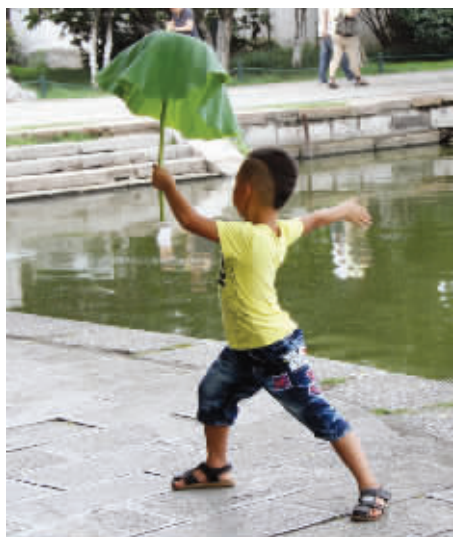
瞧这妖娆身段，让我想起芙蓉姐姐举着个墩布。 8月20日摄于莫愁湖