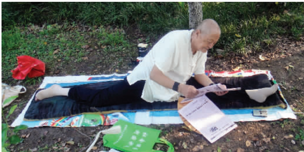
87岁老伯锻炼学习两不误，年轻人请勿模仿，容易站不起来。 8月19日摄于莫愁湖