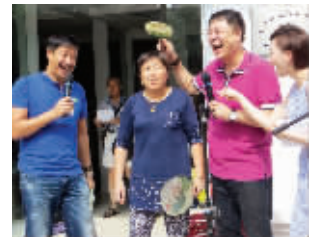
两位“女婿”逗乐了“丈母娘”